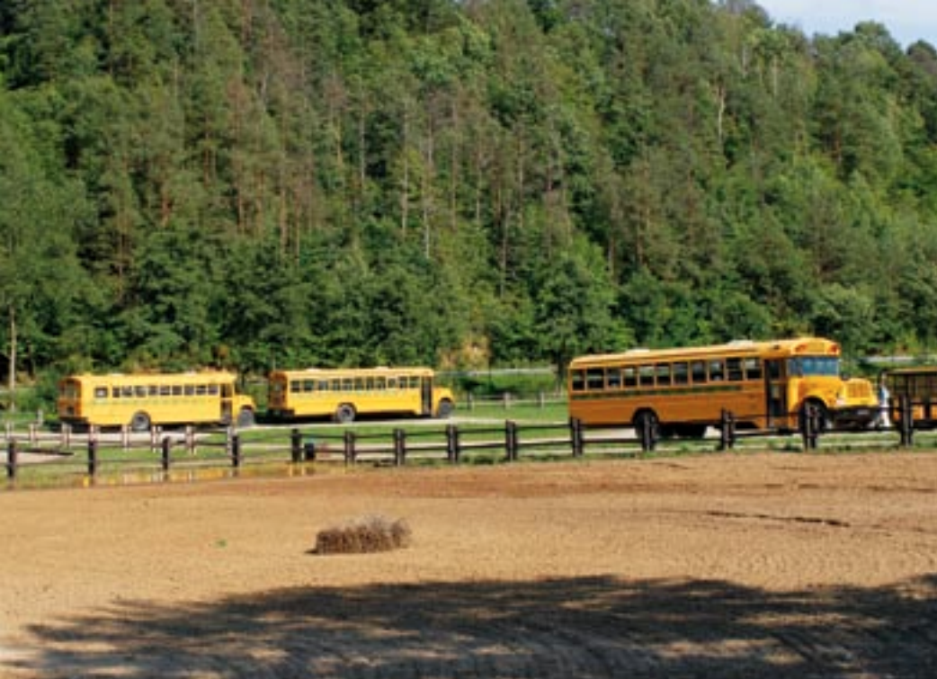
Turyści mogą zwiedzać Bałtów podróżując oryginalnymi amerykańskimi SCHOOL BUS-ami.