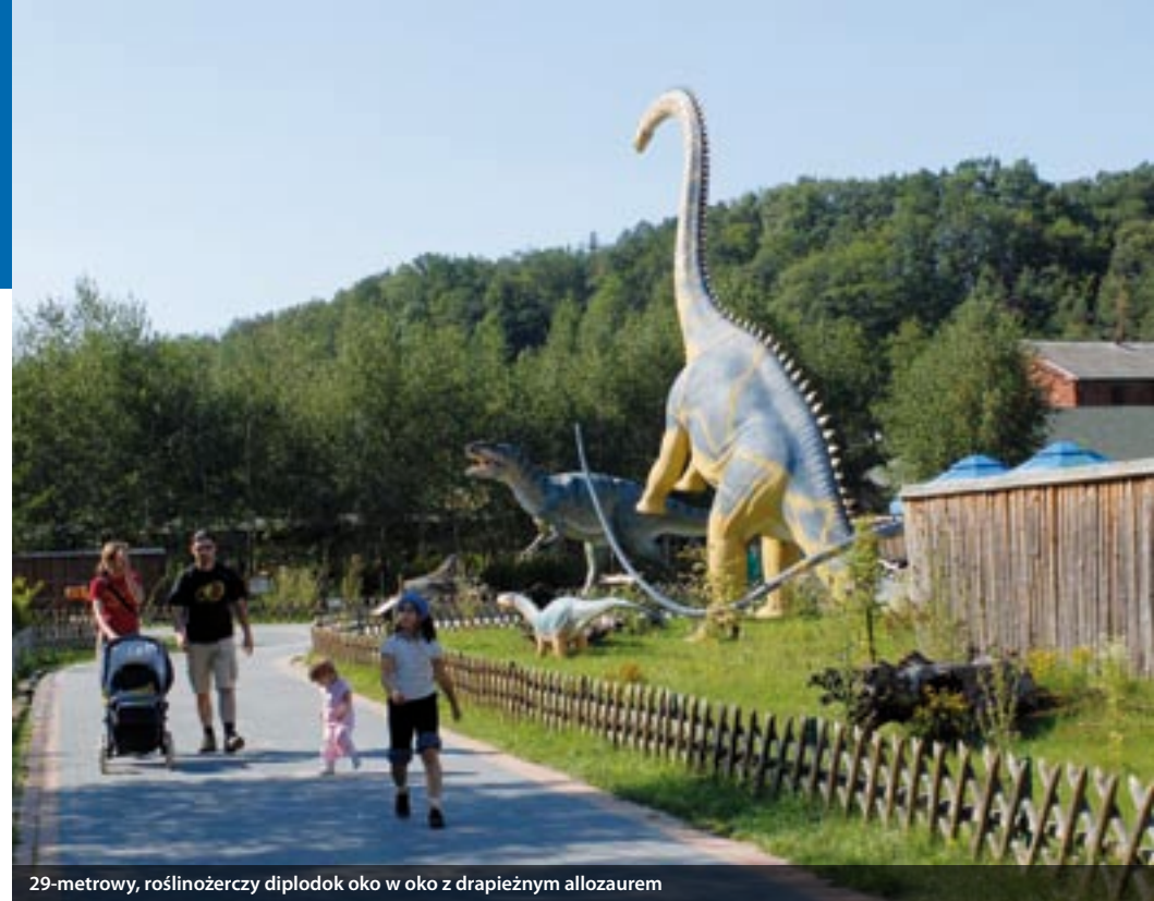
29-metrowy, roślinożerczy diplodok oko w oko z drapieżnym allozaurem

Poprzednie władze gminy niewiele w tej kwestii zrobiły – nie było kanalizacji, wodociągów, telefonii komórkowej, oczyszczalni ścieków, ani ośrodków kultury, zespołów ludowych, czy świetlic wiejskich. Władze nie były także zainteresowane