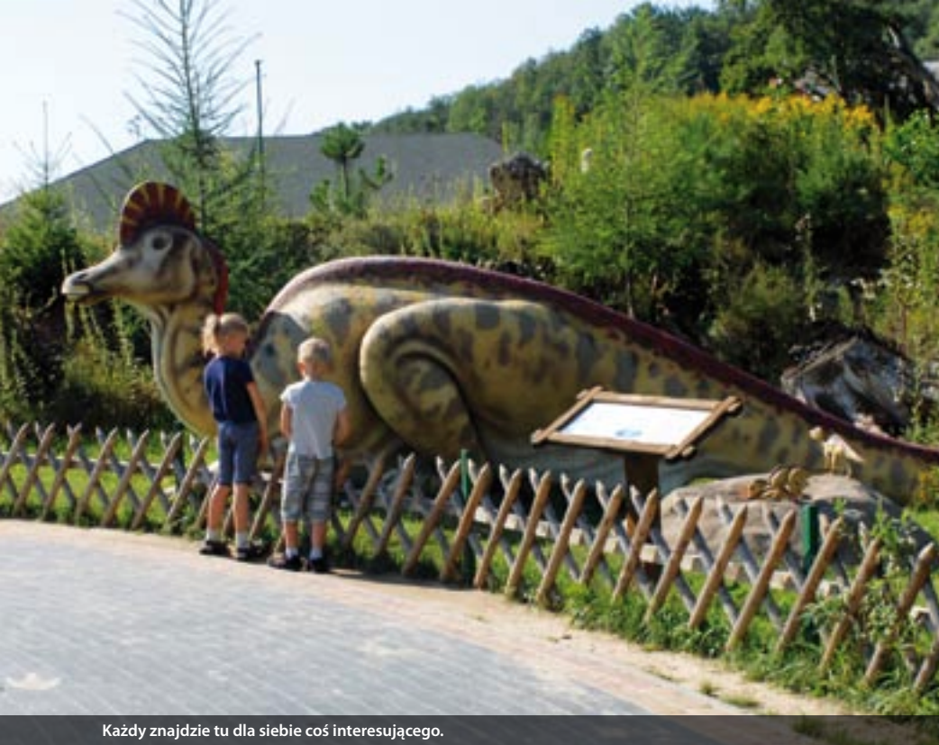
Każdy znajdzie tu dla siebie coś interesującego.

dzieci. Było bardzo ciężko. Wszyscy uciekali do Warszawy, moi dwaj bracia także wyjechali. Ludzie nie mieli nadziei, zamykali się w domach przed innymi. Teraz nikt by Bałtowa nie poznał – czyściutko, porządek w każdej posesji, prawie każdy z Bałtowa ma pracę. Pracujemy nie tylko dla siebie, jak kiedyś, ale też dla innych. Zyskałiśmy nadzieję, już nie musimy prosić się o zasiłki, znamy swoją wartość. Ludzie coraz powszechniej zaczynają działalność gospodarczą – w mojej wsi jest garncarz, który uczy dzieci swojej sztuki, są tacy, co robią dinozaury z szyszek, bo u nas dinozaury są wszędzie! Stowarzyszenie „Bałt” umożliwia