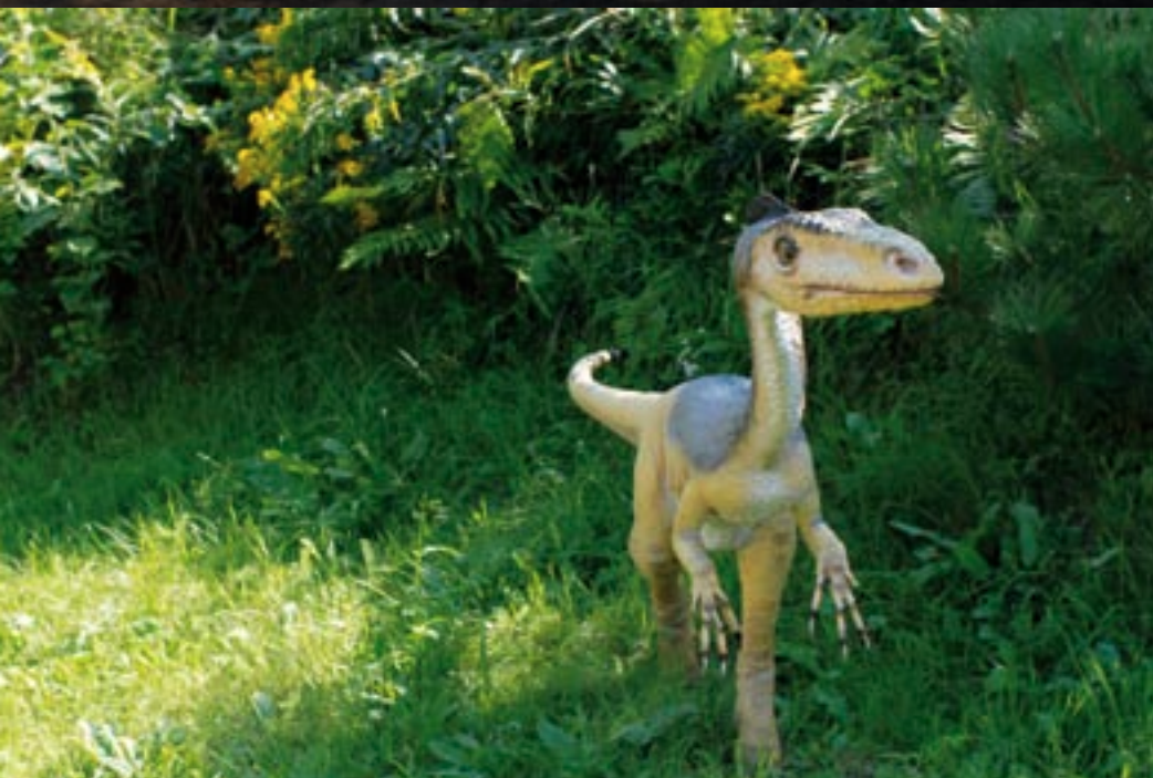
– No i co by tutaj „zmaistrować”? – zastanawia się jeden z mieszkańców Bałtowskiego Parku Jurajskiego.