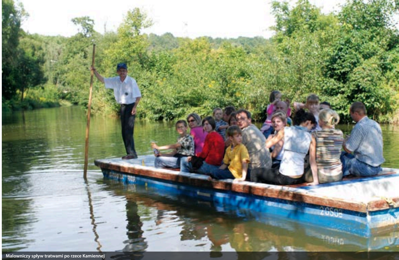
Malowniczy spływ tratwami po rzece Kamiennej

W realizację projektu rozwoju Bałtowa angażują się różnorodne grupy