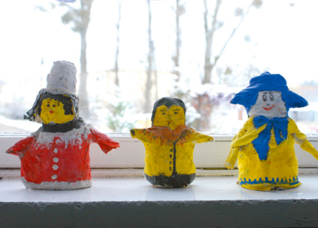
Figurki wykonane przez dzieci z klas I-III