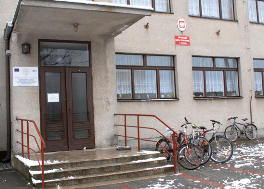
Wejście do szkoły w Sokołowie