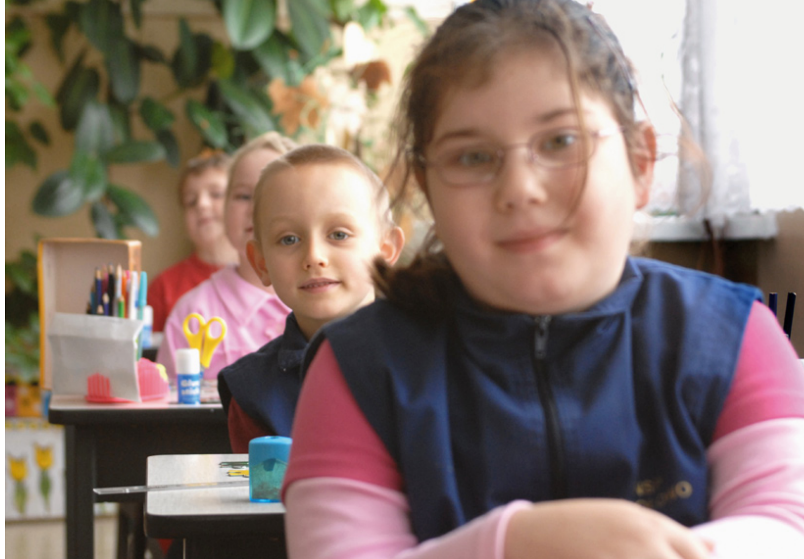
Dzieci z zerówki i I klasy

Gdy stowarzyszenie zdecydowało się otworzyć przedszkole, rodzice pomagali wyremontować sale, teraz niekiedy opiekują się maluchami. – Zgłosiło się więcej