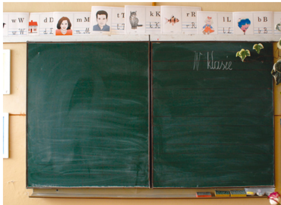
Tablica w klasie łączącej dzieci z zerówki i I klasy

– Dobrze, że powstało stowarzyszenie. Obronili małą szkołę. W naszej gminie to jedyna placówka, której nie prowadzi samorząd. Teraz, po latach, to do nich przyjeżdżają inni i podpatrują, w jaki sposób można zorganizować i prowadzić szkołę. Mieszkańcy wsi coraz częściej zastanawiają się, czy będą umieli obronić swoją placówkę. Dzieci w szkołach jest coraz mniej.