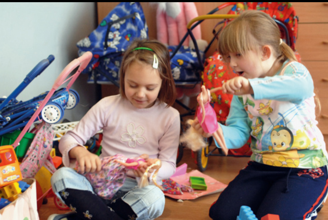
Przedszkolaki w pracy