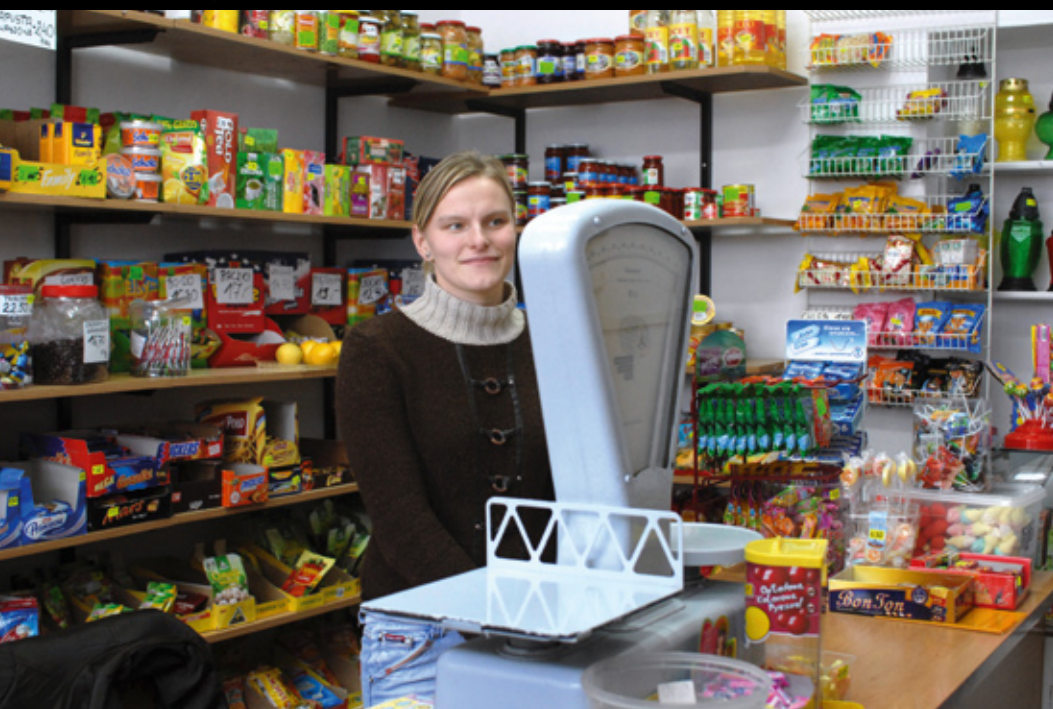
Sklepik spożywczy w szkole

Dodatkowo szkoły prowadzone przez stowarzyszenia nauczycielskie z pomocą rodziców na terenach wiejskich, szczególnie w dawnych PGR, pełnią funkcje nie tylko edukacyjne, ale także kulturalne.