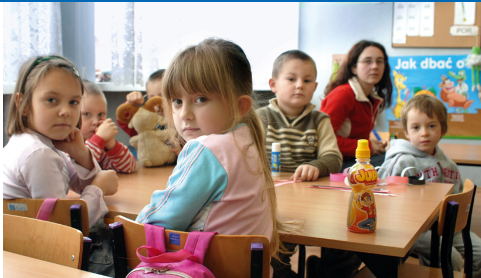
Małe przedszkole w Sokołowie prowadzone przez stowarzyszenie

mam pojęcia, nikt z nas, nauczycieli, nie będzie umiał odpowiedzieć na to pytanie, bo nigdy się nad tym nie zastanawialiśmy. Nie próbowaliśmy jej określić, po prostu chcemy, by istniała nasza szkoła.